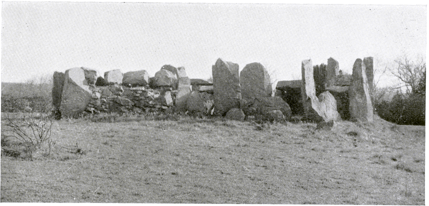
B. The Burial Chamber, looking South-east.