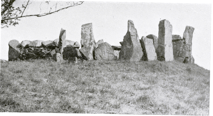
A. The Burial Chamber, looking South.